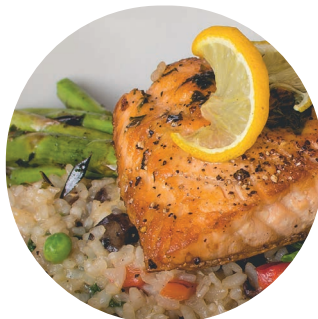
Fischfilet mit Gemüsereis