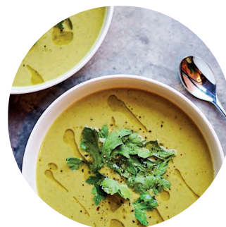
Brokkoli- Kartoffel-Suppe mit Kürbiskernöl