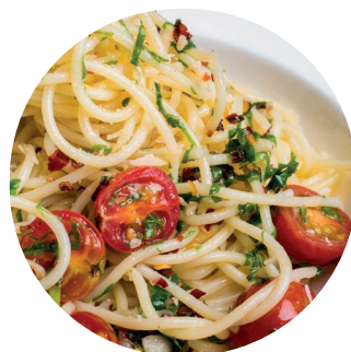
Spaghetti mit Olivenöl, frischen Tomaten und Käse

Mindestens einmal pro Woche sollte eine Mahlzeit mit Fisch auf dem Speiseplan stehen.